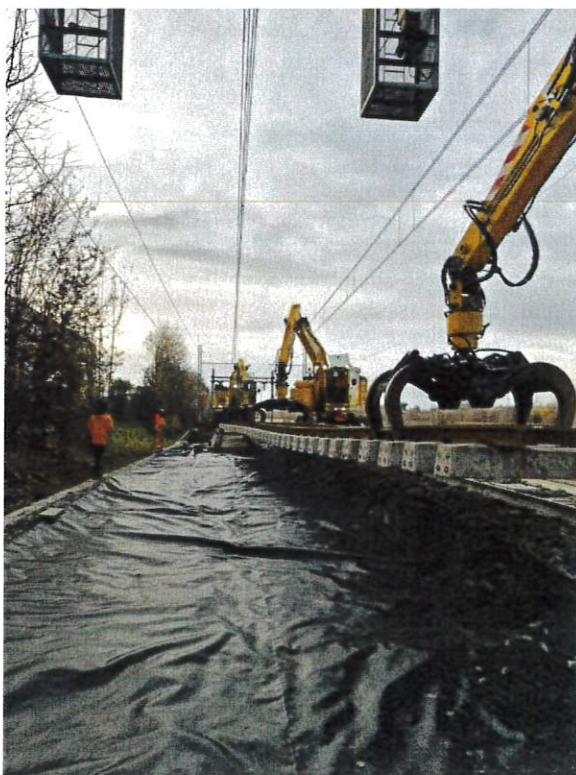
BOLOGNA SAN DONATO – DICEMBRE 2025 Posa di 500mt di binario con Ecoballast.

Oltre al notevole incremento di subappalti sopra descritti, vanno evidenziate nuove commesse, dove oltre a eseguire il lavoro, la ditta Bonaventura ha eseguito con Progress Rail in ATI nel corso del 2025 una fornitura per il cantiere FNM linea Iseo-Edolo per circa Euro 600.000