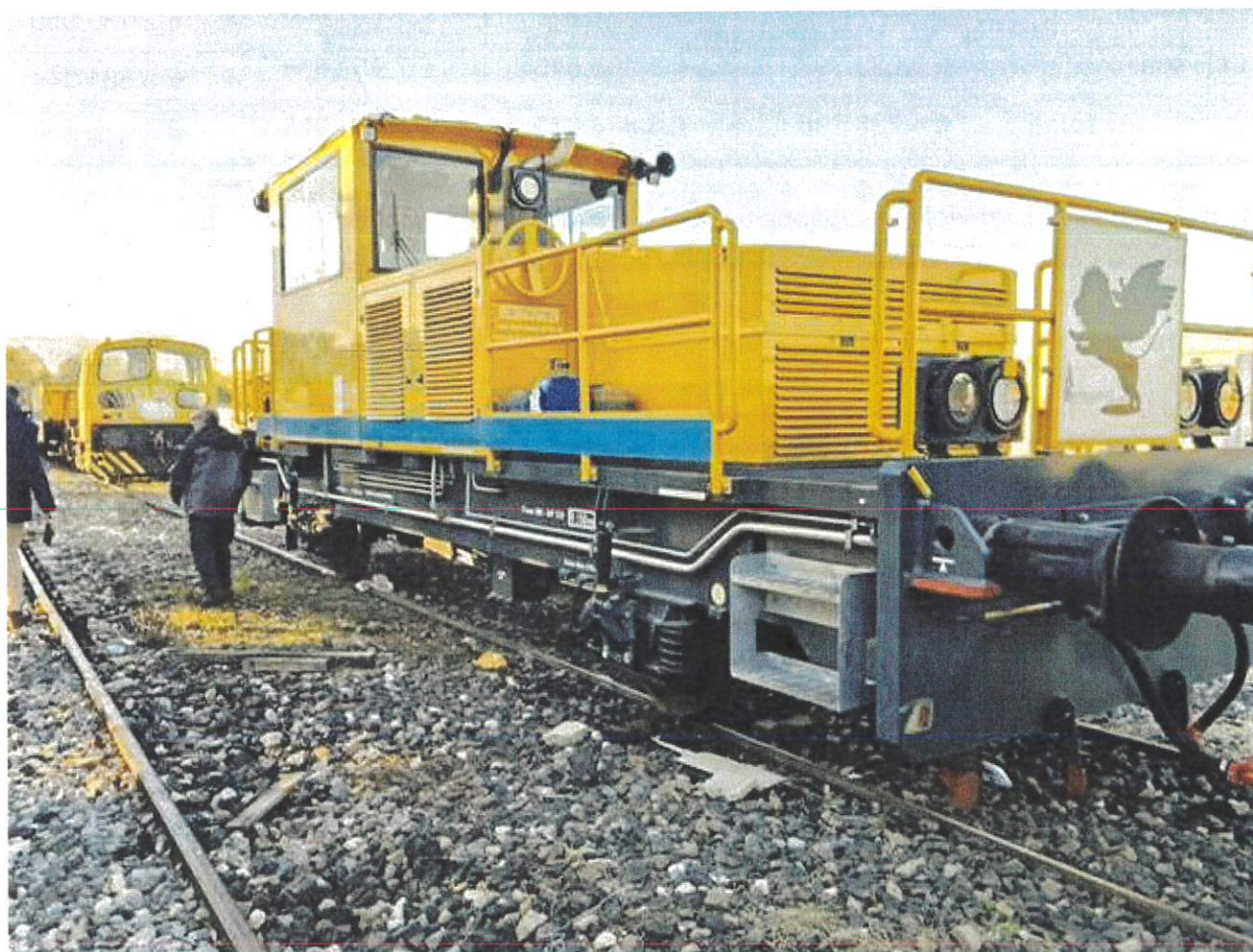
LOCOMOTORE NUOVO MODELLO GLEIFREI 350V3

Si segnala che alcuni investimenti sono stati rallentati e sospesi in attesa dell'iper ammortamento previsto per il 2026 e a causa della mancanza di fondi da parte del MISE per l'anno 2024 per 4.0.